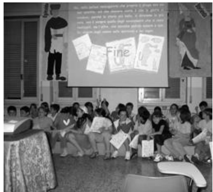
Studenti dell'elementare durante la presentazione del loro sito www.europe4kids.it