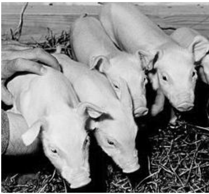
Maialini in un allevamento: da animali così piccoli sarebbe partito il contagio

Nella zona di sorveglianza, posta invece ad ulteriori 10 chilometri di distanza dal focolaio, sono individuate altre 81 stalle (a Lodi, Cornegiano, Massalengo, Pieve, Villanova, Borghetto, Livraga, Turano, Abbadia e Corte Palasio, parte di San Martino, Graffignana, Brembio, San Colombano, Orio Litta, Ospedaletto, Somaglia, Casale, Terranova, Secugnago, Bertinico, Credera-Rubbiano e Casaleto Cedredano). Da mercoledì a venerdì, giorni nei quali avverrà l'abbattimento dei maiali, le stalle coinvolte non dovranno movimentare i loro bestiame. «Una squadra di operai di