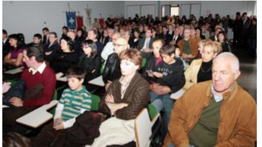
Il folto pubblico intervenuto alla cerimonia delle benemeritenze Avis, sotto a sinistra i relatori